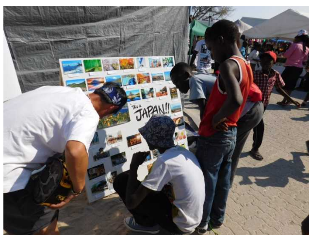
日本の四季、風景、食べ物などを照会する写真パネルを展示 Various pictures that introduce Japanese scenery of different seasons, delicious cuisine, skyscrapers.