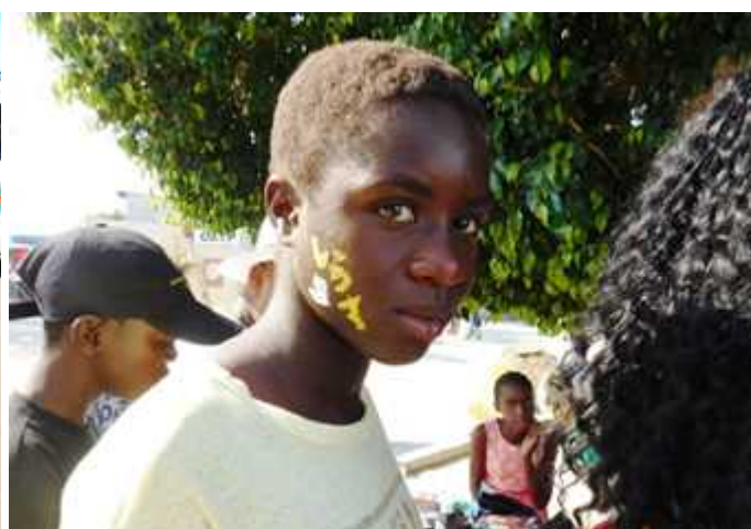
フェイスペインティング・サービス Face Painting Service