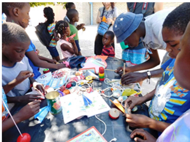
Origami, paper folding Japanese craft