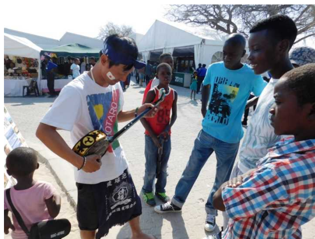
三線（沖縄の伝統楽器）を演奏する JOCV

JOCV playing "SANSHIN", musical instrument from Okinawa, Japan