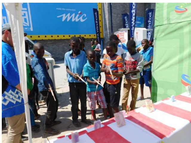
割り箸鉄砲での撃ち

Guns made out of chop sticks and rubber band aiming at the small Boxes.