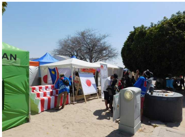
日本の展示ブース Japan's Exhibition Stand