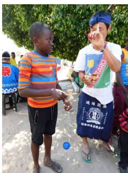
様々な日本の伝統的なおもちゃの紹介 Variety of Japanese traditional toys