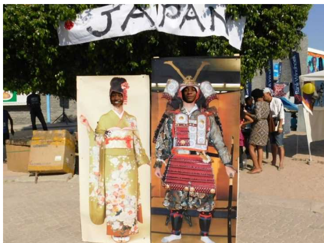
着物、鎧姿の顔はめ写真パネル

Picture boards- you can take pictures as if you are wearing Amour worn by the samurai, Japanese warrior, and Kimono, traditional female cloths.