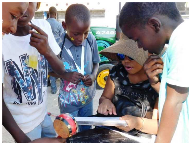
日本の食、アニメキャラクター等を三択で問う日本クイズも実施 Children answering Japanese quiz

Picture boards- you can take pictures as if you are wearing Amour worn by the samurai, Japanese warrior, and Kimono, traditional female cloths.