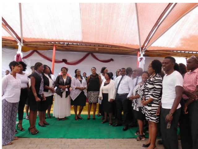
教員による感謝の歌の披露