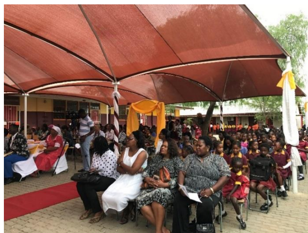
地元コミュニティに根ざした学校運営を反映するように、式典には、生徒と保護者のみならず、同校卒業生、元教員、地元住民なども多く出席した。