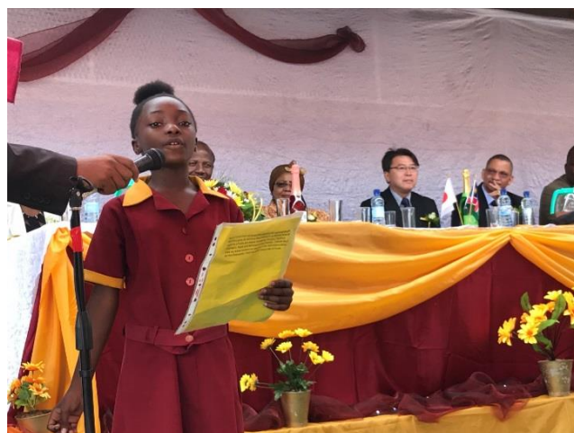
全校生徒を代表してスピーチする5年生の女生徒。 「日本からの素晴らしい贈り物により、全校生徒がよりよい環境で 一層学ぶことを楽しめるようになった」と感謝を述べた。