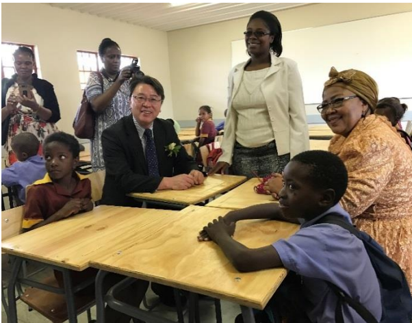
教室は、すぐにも利用できる状態に準備されていた。