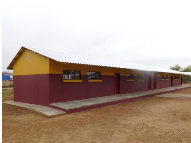
我が方支援の校舎。丁寧に仕上げられている。