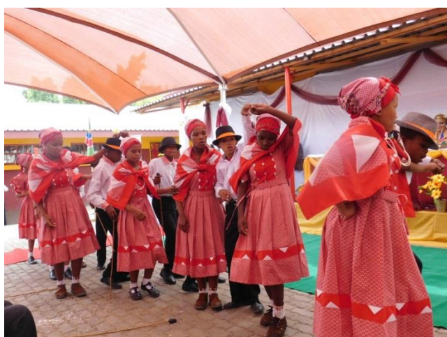
生徒による踊りの披露。観客、子どもたちを含め会場全体が大いに盛り上がった。