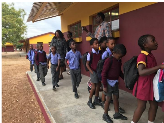
序幕式終了後、嬉々として新しい教室に入る2年生たち。