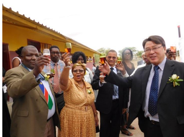
引き渡した校舎の前で、プロジェクトの成功を祝して乾杯する関係者一同。