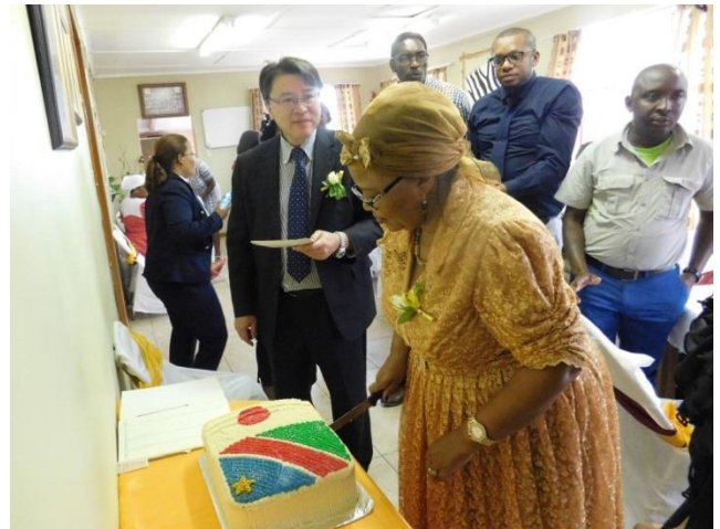
ナミビアと日本の国旗が描かれたケーキに入刀する大臣。