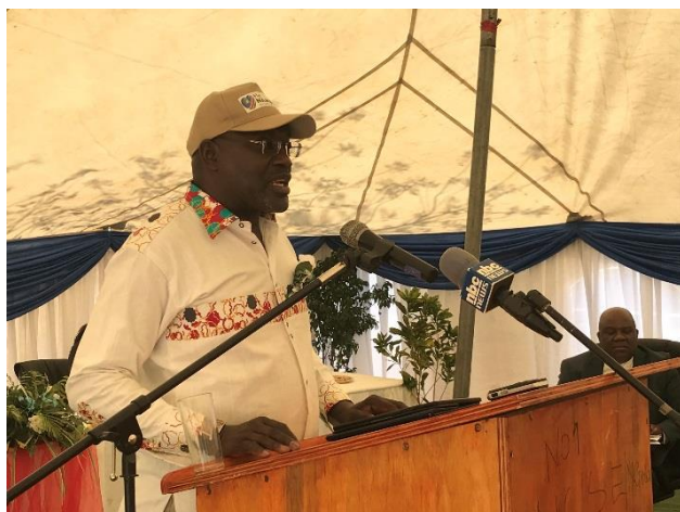
トゥエヤ産業化・貿易・中小企業開発大臣挨拶。当初出席予定であったムブンバ副大統領の代理として出席した。