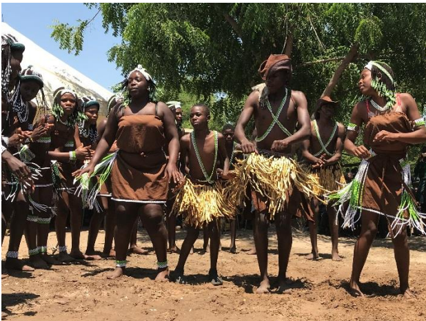
生徒による伝統的な踊りと歌の披露。観客、子どもたちを含め会場全体が大いに盛り上がった。