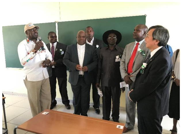
我が方支援の校舎は、丁寧に仕上げられており、学校家具の調達を完了し、いつでも使用できる状態になっていた。