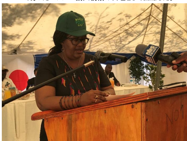
アウシク州知事挨拶