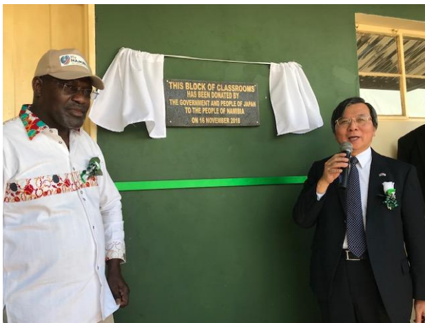
我が方支援を記す記念プラークの序幕式。