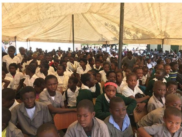
式典が行われた会場は、650名を超える生徒、教員、近隣校の校長先生によって埋め尽くされた。