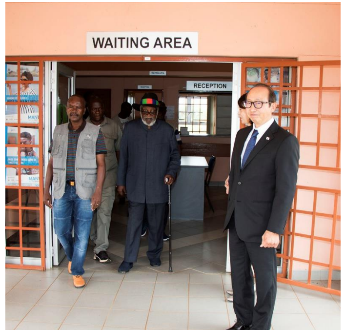
又ヨマ初代大統領が建設した診療所（正面玄関）