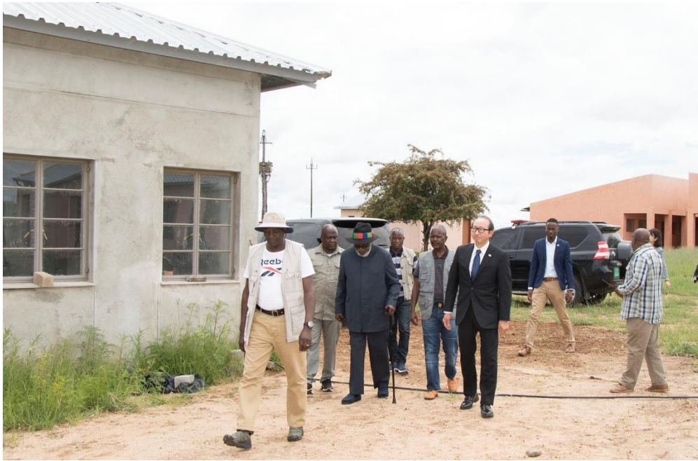
又ヨマ初代大統領が建設した学校へと向かう西牧大使及び又ヨマ初代大統領