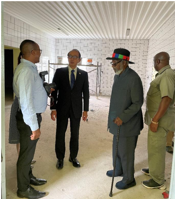
又ヨマ初代大統領が建設した学校（キッチン）